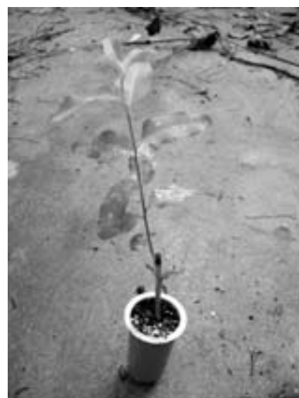
● Plantin clonal

Estos marcadores consisten en regiones del genoma que contienen secuencias simples repetitivas que son amplificadas a través de PCR utilizando un par de primers específicos (de 20 a 30 bases), complementarias a secuencias únicas que flanquean al microsatélite. Estas regiones son altamente polimórficas entre los individuos, ricas en formas alélicas, posibilitando un análisis genético preciso y un elevado poder de resolución para el test de DHE.