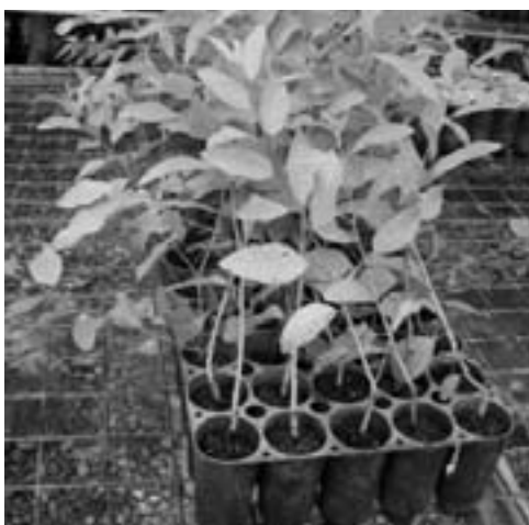
● Bandeja clonal

El uso comercial de la producción clonal requie-