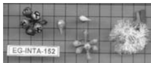
● Flores Clon EG-INTA-152

5-Preferentemente, debe conocerse su localización cromosómica.